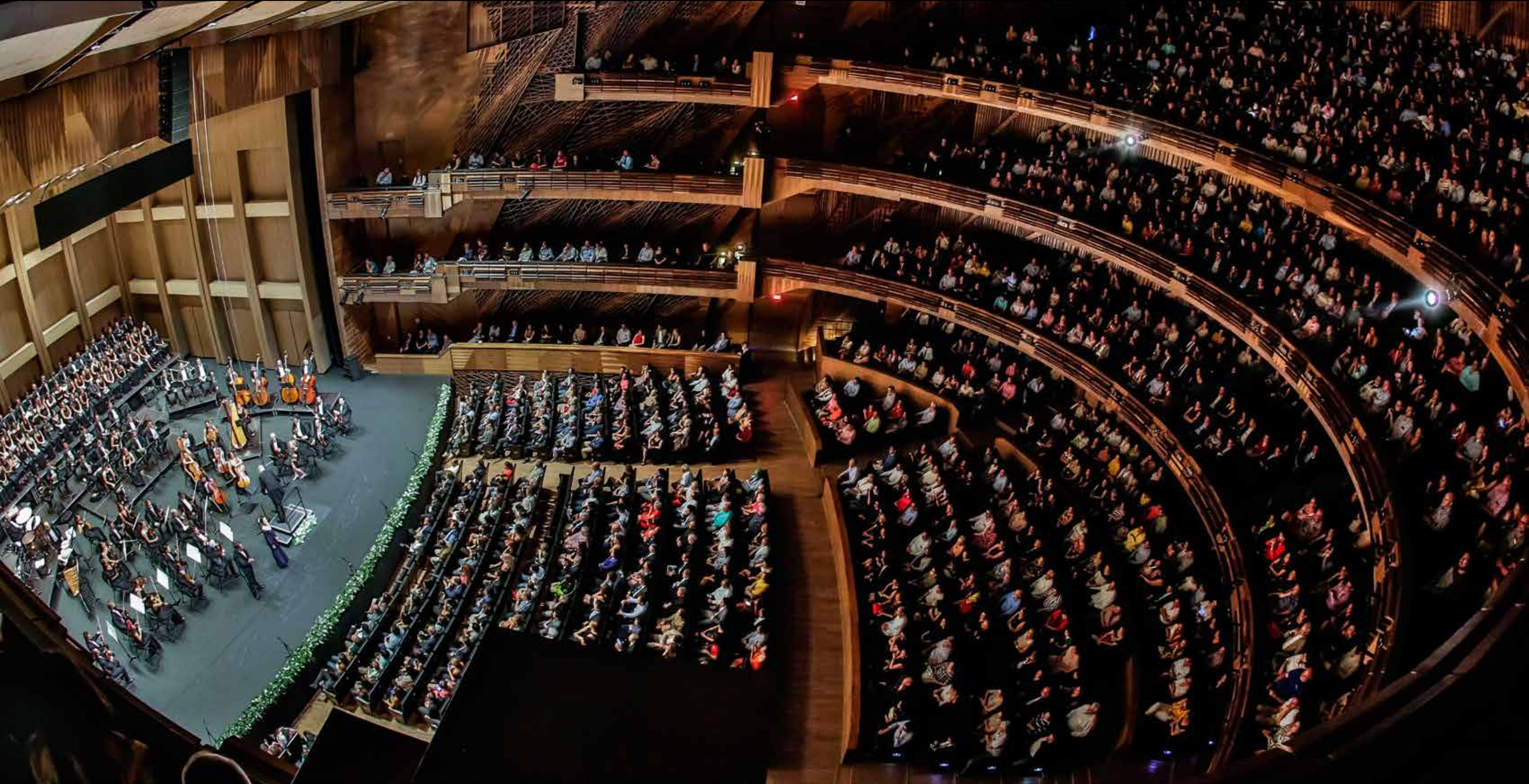
Sala 1800 CONJUNTO SANTANDER DE ARTES ESCÉNICAS